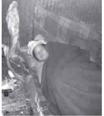
ငှက်ဖျားစွဲကပ်ပြီး မူးယစ်ဆေးစွဲသူ ယောက်ျားမှ ပစ်ထားခံရသူ တစ်ဦး

ရလာတော့ ဆေးလုံးဝ ဝယ်ပေးတာမဟုတ်ပါဘူး။ သူဆေးသုံး ငွေပဲ ဝယ်လိုက်တာပါ။ ဒီမိမှာလည်း ဘာမျှ မကျန်တော့ပါဘူး။ သူယူသွားပြီး ဆေးဖိုးအတွက်ရောင်းပစ်တာ ကုန်ပါပြီ။ “(တွေ့ဆုံမေးမြန်းခြင်း အမှတ် -၁၈)