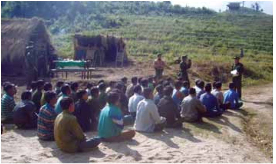
(PSLA) ၏ မူးယစ်ဆေးဖြတ် ပြန်လည်ထူထောင်ရေးစခန်းတစ်ခု

(၂၀၀၀) ခုနှစ် အစပိုင်းတွင် ပလောင်ဒေသများအတွင်း မူးယစ်ဆေးစွဲမှု ပိုမိုများပြားလာသည့်ပြဿနာအား ကိုင်တွယ်ဖြေရှင်းနိုင်ရန် ပလောင်ပြည်နယ်လွတ်မြောက်ရေးတပ်မတော် (PSLA) သည် ဒေသခံမူးယစ်ဆေးစွဲသူများအတွက် ကျေးရွာအချို့တွင် မူးယစ်ဆေးဖြတ် ပြန်လည်ထူထောင်ရေးစခန်းများ ဖွင့်လှစ်ခဲ့ပါသည်။ ၎င်းတို့သည် ကျေးရွာ အသီးသီးရှိ မူးယစ်ဆေးစွဲသူများစာရင်းကို ကောက်ယူရ ဆောင်းပြီး၊ ၎င်းတို့အားသတ်မှတ်ထားသည့်နေရာဒေသများတွင် တစ်ခါတရံတွင် ဘုန်းကြီးကျောင်းများတွင် စုစည်းစေသည်။ မူးယစ်ဆေးစွဲသူများကို တဲများတွင်အိပ်စေပြီး၊ မူးယစ်ဆေးစွဲခြင်းမှ ပြန်လည်ထူထောင်ကောင်းမွန်ရန် ကြိုးပမ်းနေသောအချိန်တွင်၊ တံတားဆောက်ခြင်းကဲ့သို့သော လူထုအကျိုးပြုလုပ်ငန်းများ လုပ်ဆောင်စေပါသည်။ စခန်းများအတွင်း နေထိုင်ရသည့် အချိန်ကာလသည် ဆေးစွဲသူ များ၏ ပြန်လည်ထူထောင်ကောင်းမွန်လာမှုအပေါ်တွင် မူတည်ပါသည်။ အချို့သောသူများသည် တစ်လကြာ နေထိုင်ခဲ့ပြီး၊