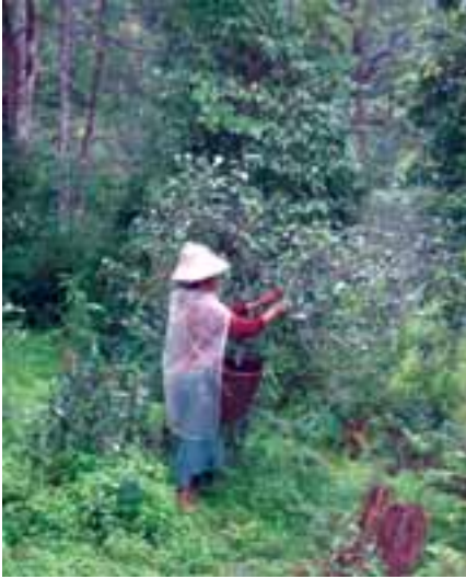
လက်ဖက်ရွက်များ ဆွတ်ခူးနေပုံ

စစ်အစိုးရအဆက်ဆက်သည်။ တိုင်းရင်းသားလူမျိုးစုများ နေထိုင်ရာဒေသများသို့ ၎င်းတို့၏ချုပ်ကိုင်မှုကို ပိုမိုတိုးချဲ့ လာခဲ့ပြီး၊ လူထုများ၏ လက်ဖက်စက်ရုံများကို သိမ်းပိုက်ခဲ့ သောကြောင့်၊ များစွာသော ပြည်သူများကို ဆင်းရဲမွဲတေစေခဲ့ ပါသည်။ ယနေ့ကာလတွင် စစ်အစိုးရသည် လက်ဖက်ခြောက် ဈေးနှုန်းကို ချုပ်ကိုင်ထားပြီး၊ အခွန်ကြေးများစွာကိုလည်း ကောက်ယူလျက်ရှိပါသည်။ အကယ်၍ တစ်စုံတစ်ယောက် သည် ယနေ့ကာလတွင် လက်ဖက်စိုက်ခင်း စတင်လုပ်ကိုင်စိုက် ပျိုးလိုပါက၊ အခွန်ငွေများစွာပေးရမည်ဖြစ်ပါသည်။ ငွေကြေး ဖောင်းပွခြင်းကြောင့် လူသုံးကုန်ပစ္စည်းအများစုကို ဈေးနှုန်း တက်စေသော်လည်း၊ လက်ဖက်ခြောက်ဈေးနှုန်းများသည် အခြားကုန်များကဲ့သို့ အလျင်မီတက်လာခြင်း မရှိပါ။ ထို့အပြင် (နအဖ) စစ်အစိုးရသည် ပလောင်လက်ဖက်စိုက်ပျိုးသူများကို ခွဲတမ်းစနစ်ဖြင့် နိုင်ငံတော်သို့ လက်ဖက်ရောင်းချစေရန်