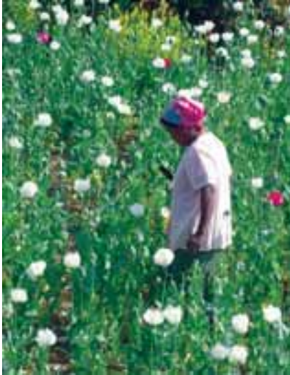
ဘိန်းခင်းများကို ပြုစုနေပုံ

ပလောင်လူမျိုးများစွာတို့သည် အခြားသောသူများ ပိုင်ဆိုင်သည့် ဘိန်းခင်းများတွင်၊ အလုပ်သမားများ ဖြစ်လာကြပါသည်။ အဆိုပါ ဘိန်းခင်းပိုင်ရှင်များသည် အများအားဖြင့် တရုတ်လူမျိုးများဖြစ်ပြီး၊ စစ်အစိုးရမှ ဘိန်းစိုက်ပျိုးရန်ခွင့်ပြုထားသည့် ပြည်သူ့စစ်အုပ်စုများ၏ ခွင့်ပြုချက်ဖြင့် စိုက်ပျိုးထုတ်လုပ် နေကြခြင်းဖြစ်ပါသည်။ “ ပထမတော့ သူက ဘိန်းစိုက်တဲ့ တရုတ်ရွာတစ်ရွာမှာ အလုပ်သွားလုပ်ပါတယ်။ အခြားနေရာတွေမှာ ဘိန်းစိုက်ခွင့်မရှိပေမယ့်လည်း အဲဒီရွာတိုက်မှာ နှစ်စဉ်နှစ်တိုင်း ဘိန်းစိုက်ဖို့ခွင့်ပြုထားတဲ့ တရုတ်ရွာတွေ အများကြီးရှိပါတယ်။ “ (တွေ့ဆုံမေးမြန်းခြင်း အမှတ်- ၅၄)