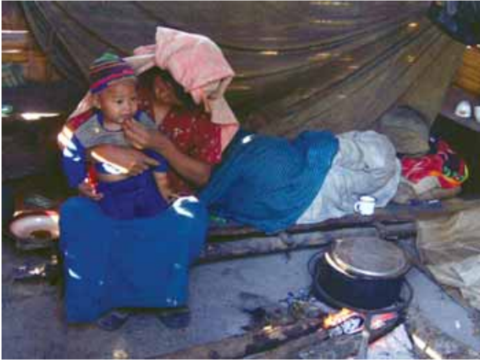
အမျိုးသမီးများရဲ့ အသံ