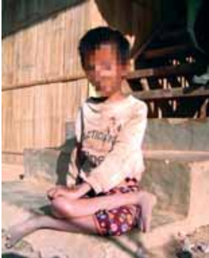
ပိုလီယိုဝေဒနာရှင် ကလေးတစ်ဦး

ပလောင်လူမျိုးအများစုသည် ကျန်းမာရေးစောင့်ရှောက်မှု ရရှိနိုင်မှု နည်းပါးလှပါသည်။ အထူးသဖြင့် ဝေးလံသော တောင် တန်းများ ပေါ်တွင် နေထိုင်ကြသည့်သူများအတွက် ပို၍ဆိုးပါသည်။ ကျေးရွာ (၁၀) ရွာခန့်တွင် ဆေးပေးခန်းတစ်ခုမျှ ရှိပါသည်။ ရောဂါဆေးဒနာရှင်များက ဆေးဝါးများအားလုံး အတွက် ကျခံရပြီး၊ မြို့ပြဒေသများထက် ဈေးနှုန်းမြင့်၍ ဝယ်ယူကြ ရပါသည်။ အကျိုးဆက်အဖြစ် ရွာသူရွာသား အများစုသည် ဆေးသင်တန်း စနစ်တကျမသင်ယူခဲ့ရသည့် တိုင်းရင်းဆေးဆရာများကိုသာ မှီခိုအားထား နေကြရပါသည်။